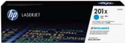
Cartucho de tóner original HP con JetIntelligence

Los cartuchos de tóner originales HP con JetIntelligence proporcionan a su empresa más páginas, 3 el máximo desempeño de impresión y la protección adicional de la tecnología antifraude, algo que la competencia no puede igualar.