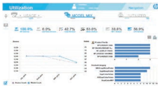
Ejemplo de informe sobre el uso de la flota

Para obtener más información sobre el Servicio de Asesoría de Impresión Proactiva de HP, visite hp.com/go/proactiveprintadvisor