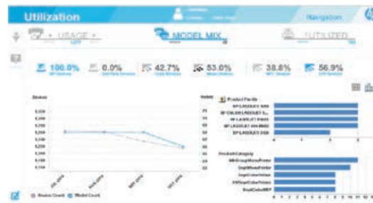
Beispiel eines Auslastungsberichts

Weitere Informationen zu HP Proactive Print Advisor finden Sie unter hp.com/go/proactiveprintadvisor .