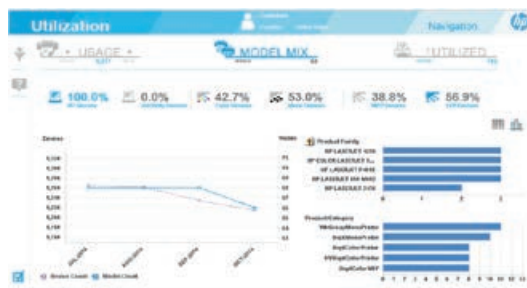
Exemple de rapport d'utilisation

Pour en savoir plus sur le service HP Proactive Print Advisor, consultez hp.com/go/proactiveprintadvisor