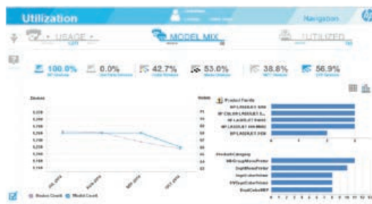
Esempio di report sull'utilizzo

Per maggiori informazioni sul servizio HP Proactive Print Advisor, visita hp.com/go/proactiveprintadvisor