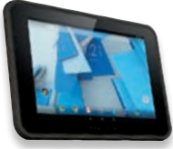
HP Pro Slate 10 EE