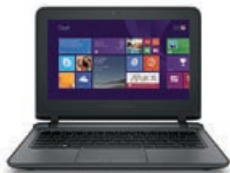
HP ProBook 11 EE