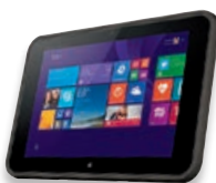
Tablette HP Pro 10 EE