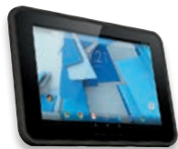
HP Pro Slate 10 EE