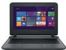
HP ProBook 11 EE