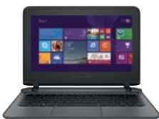
HP ProBook 11 EE