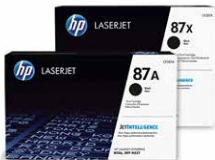
Cartucce di toner originali HP con JetIntelligence

Ottenete il meglio dalla vostra stampante. Stampate più pagine, sempre con l'ineguagliabile alta qualità, utilizzando le cartucce di toner originali HP espressamente progettate con JetIntelligence. Contate su prestazioni migliori, un'efficienza energetica più elevata e sull'autentica qualità HP su cui avete investito, semplicemente irraggiungibile per la concorrenza. 3