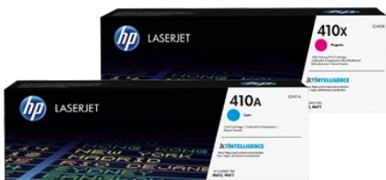
Original HP Tonerkartuschen mit JetIntelligence

Holen Sie das Beste aus Ihrem MFP heraus. Drucken Sie mehr Seiten von professioneller Qualität als je zuvor 2 – mit den speziell konzipierten Original HP Tonerkartuschen mit JetIntelligence. Profitieren Sie von optimierter Leistung, höherer Effizienz und der bewährten HP Qualität, für die Sie bezahlt haben – Technologien, die Ihnen so kein anderer Hersteller bietet. 2