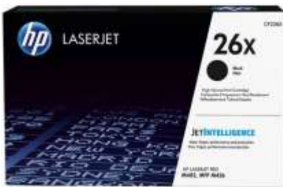
Cartucho de tóner HP original con JetIntelligence

Obtenga lo mejor de su impresora multifuncional. Imprima páginas de alta calidad más uniformes que nunca, 2 mediante cartuchos de tóner originales HP diseñados especialmente con JetIntelligence. Cuente con un mejor rendimiento, mayor eficiencia energética y la auténtica calidad HP por la que pagó, algo que la competencia simplemente no puede igualar. 2