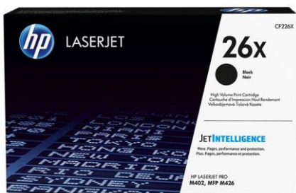
Cartucce toner originali HP con JetIntelligence

Ottieni il massimo dalla tua multifunzione. Stampa più pagine di quanto tu abbia mai fatto ad alta qualità costante 2 , usando le cartucce toner originali HP specificamente progettate con JetIntelligence. Potrai contare su migliori prestazioni, maggior efficienza energetica e l'autentica qualità HP per cui hai pagato: ovvero qualcosa che la concorrenza semplicemente non può offrire. 2