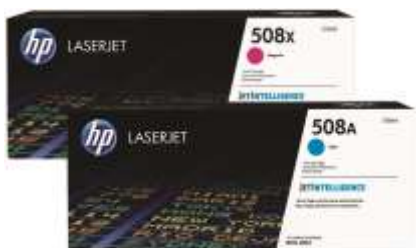
Cartuchos de toner HP originais com JetIntelligence

Aproveite o melhor de seu MFP. Imprima páginas com qualidade mais profissional do que nunca 2 usando cartuchos de toner originais HP especialmente projetados com JetIntelligence. Conte com desempenho superior, maior eficiência energética e a autêntica qualidade da HP pela qual você pagou — algo que a concorrência simplesmente não consegue oferecer. 2