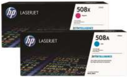
Cartuchos de tóner HP originales con JetIntelligence

Obtenga lo mejor de su impresora multifunción. Imprima más páginas profesionales de alta calidad que nunca 2 usando cartuchos de tóner HP originales diseñados especialmente con JetIntelligence. Cuente con un mejor rendimiento, mayor eficiencia energética y la auténtica calidad HP por la que pagó, algo que la competencia simplemente no puede igualar. 2