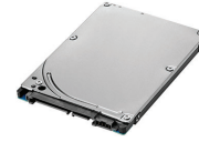
כונן HP 3D 256GB SATA Solid State Drive

הרחב את יכולות האחסון של שולחן העבודה שלך עם HP 3D 256 GB SATA SSD, אשר כולל כונן 3D VNAND flash עבור ביצועי קריאה/כתיבה מרשימים ואמינות, וכן אותם ביצועים יציבים שאתה כבר רגיל לקבל מכונני ה-SSD הנוכחיים שלך. מספר מוצר: N1M49AA