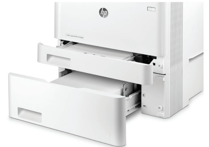
HP LaserJet Pro M452dn valinnaisella 550 arkin alustalla