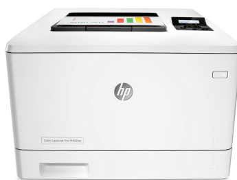
HP LaserJet Pro M452dn

Prestazioni di stampa ideali e sicurezza affidabile per la modalità di lavoro. Questa affidabile stampante a colori è in grado di completare i lavori più velocemente e offre una protezione completa contro le minacce. 1 Le cartucce toner originali HP con JetIntelligence producono più pagine. 2