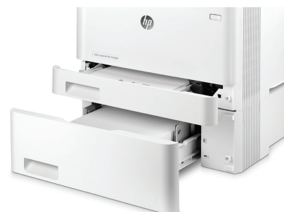
HP LaserJet Pro M452dn z opcjonalnym drugim podajnikiem na 550 arkuszy