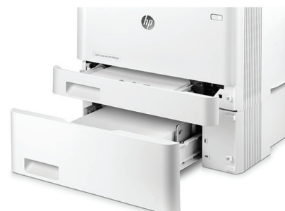
HP LaserJet Pro M452dn z opcjonalnym drugim podajnikiem na 550 arkuszy