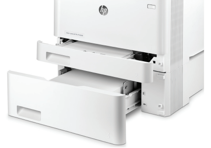
İsteğe bağlı 550 yapraklık tepsiye sahip HP LaserJet Pro M452dn