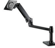
זרוע HP Single Monitor Arm

הרחב את יכולות האחסון של שולחן העבודה שלך עם HP 3D 256 GB SATA SSD, אשר כולל כונן 3D VNAND flash עבור ביצועי קריאה/כתיבה מרשימים ואמינות, וכן אותם ביצועים יציבים שאתה כבר גייל לקבל מכונני ה-SSD הנוכחיים שלך.