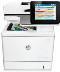
MFP HP Color LaserJet Enterprise M577dn

Ideal para médias e grandes empresas que precisem de uma MFP a cores segura, altamente produtiva, com eficiência energética.