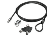
מנעול כבל HP Docking Station Cable Lock

מתוכנן במיוחד עבור מחשבי HP EliteBook Notebook PC דקים במיוחד, תחנת העגינה HP UltraSlim Docking Station מרחיבה את אפשרויות התצוגה, הרשת וקישוריות ההתקן כך שתוכל להיות פרודוקטיבי יותר במהלך יום העבודה—כל אלה באמצעות עגינה עם חיבור צדדי בלחיצה אחת פשוטה.