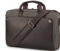
תיק מנהלים חום עם פתח עליון של HP בגודל 39.6 ס"מ x 15.6 אינץ'

עבודה בחוכמה והגדל את שטח העבודה הפנוי שלך בעזרת המקלדת והעכבר הדקים והמסוגננים של HP עם חיבור USB, שתוכננו כהשלמה למחשבים העסקיים של HP מדגמי 2015.