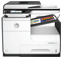
Imprimante multifonction HP PageWide Pro 477dw