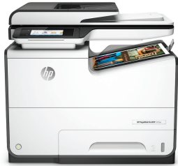
Imprimante multifonction HP PageWide Pro 577dw