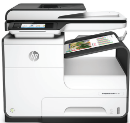
Imprimante multifonction HP PageWide Pro 477dn

Dynamic security : Les cartouches possédant des puces non HP peuvent ne pas fonctionner aujourd'hui ou dans le futur. En savoir plus : http://www.hp.com/go/learnaboutsupplies