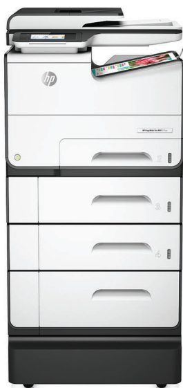
Imprimante multifonction HP PageWide Pro 577z