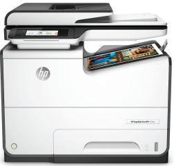
Impresora Multifunción HP PageWide Pro 577dw