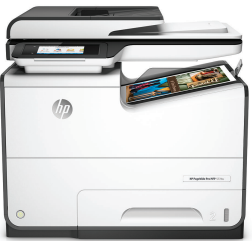
Impresora Multifunción HP PageWide Pro 577dw