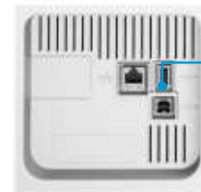
Vista posterior del panel de E/S