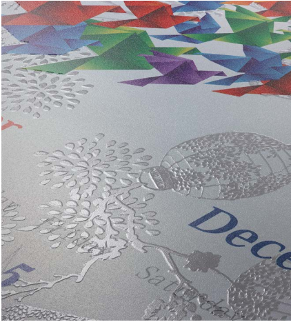
La impresión en relieve ofrece efectos táctiles.

Tecnología en color offset digital. La tecnología de electrofotografía líquida (LEP) de HP Indigo, que utiliza HP Indigo ElectroInk con partículas de tinta diminutas, ofrece líneas nítidas, imágenes atractivas y viñetas suaves con una capa de tinta muy fina que ofrece brillo uniforme entre la tinta y el material.