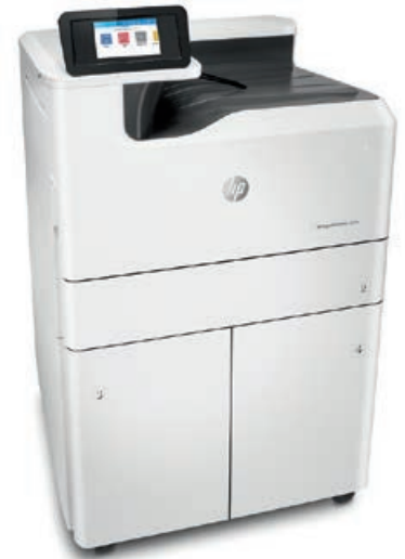
HP PageWide Pro 750dw