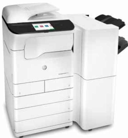
HP PageWide Pro MFP 772zt