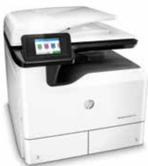
HP PageWide Pro MFP 772dn