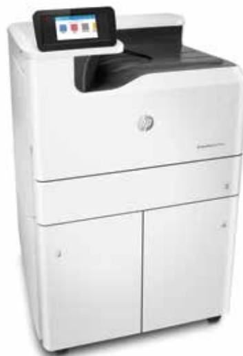
HP PageWide Pro 750dw