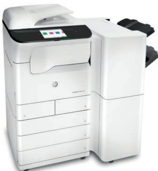
МФУ HP PageWide Pro 772zt