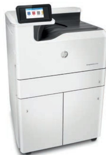
Принтер HP PageWide Pro 750dw