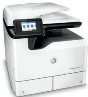
МФУ HP PageWide Pro 772dn