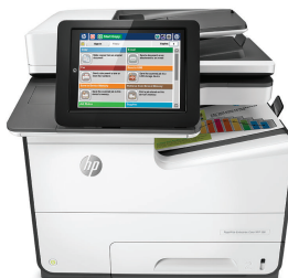
Imprimante multifonction couleur HP PageWide Enterprise 586f