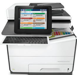
Imprimante multifonction couleur HP PageWide Enterprise Flow 586z