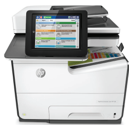
Imprimante multifonction couleur HP PageWide Enterprise 586dn

Une valeur optimale pour les entreprises d'aujourd'hui : la technologie HP PageWide offre les vitesses les plus rapides 1 et des fonctions de sécurité de pointe 2 pour le plus bas coût total de possession de sa catégorie. 3 Optimisez la productivité grâce à des fonctionnalités de workflow transparentes.