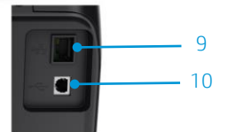
Close no painel de E/S traseiro