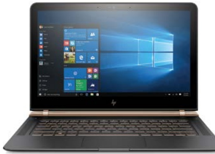
O notebook mais fino do mundo 3 HP Spectre