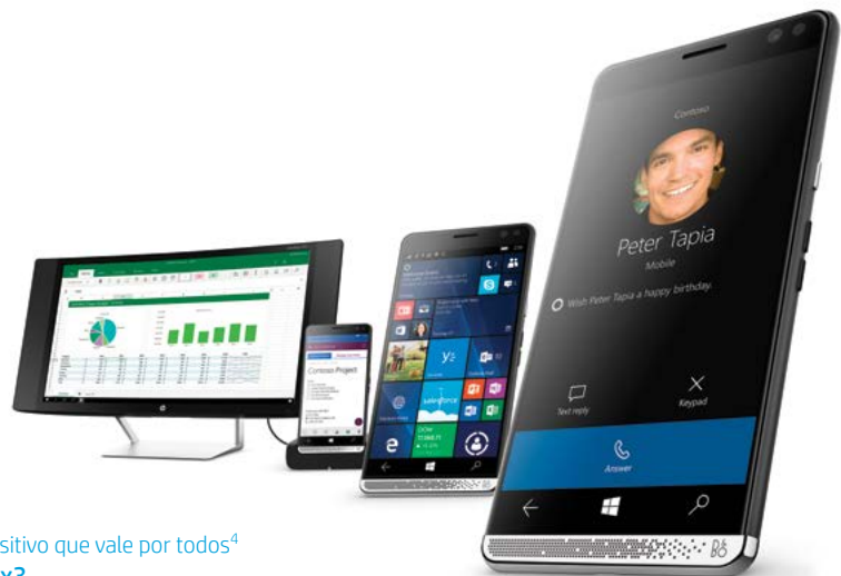
Um dispositivo que vale por todos 4 HP Elite x3

Aproveite ao máximo seu PC com monitores e acessórios da HP. Os monitores da HP oferecem amplas visualizações de seus projetos com excelente precisão de cores e conexões fáceis para um conjunto de dispositivos diários. Acessórios da HP — abrangendo tudo desde webcams a dispositivos que podem ser usados junto ao corpo — oferecem estilo, durabilidade e conectividade excepcionais para dar suporte às necessidades de tecnologia de seus usuários.