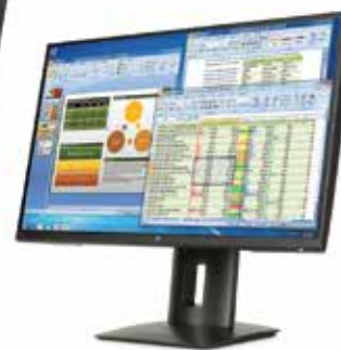
Display HP Z