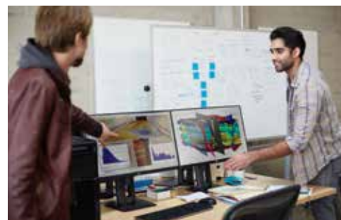
Display HP Ultra-Narrow Bezel Z

Fate del multitasking su schermi multipli una realtà. HP offre una serie di monitor per soddisfare al meglio le vostre esigenze aziendali, con tutti gli accessori essenziali per creare la vostra configurazione ideale.