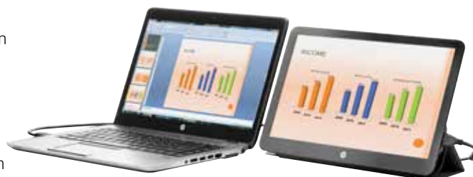
HP S140u draagbare monitor

Geef uw mobiele werknemers een voordeel op kantoor. Ze kunnen hun pc voor onderweg op kantoor koppelen met alle extra schermruimte die ze nodig hebben—sluit het notebook via een dockingstation aan of maak een werkruimte met meerdere monitoren met een USB-kabel en de docking monitor HP EliteDisplay S231d.