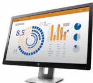
HP EliteDisplay-bildskärm E-serien

Energisnåla skärmar till bra pris för ökad framgång