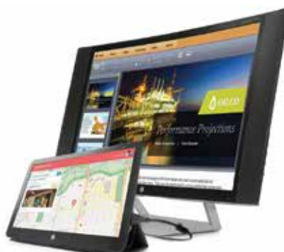
HP EliteDisplay-bildskärmar S-serien

Bekväma och energisnåla med avancerade anslutningar