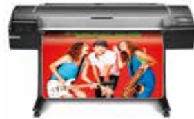
HP DesignJet Z5600 PostScript®-printer

De op pigment gebaseerde inktformule is duurzamer dan eerdere verfstoffen, waardoor er meer toepassingen mogelijk zijn