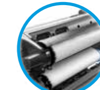
Twee rollen Slim omschakelen 11