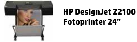
HP DesignJet Z2100 Fotoprinter 24"