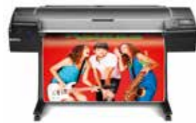
HP DesignJet Z5600 PostScript®-printer

De meest betaalbare hoogwaardige HP DesignJet- printer van 24 inch 1