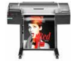
HP DesignJet Z2600 PostScript®-printer

De meest betaalbare hoogwaardige HP DesignJet- printer van 24 inch 1