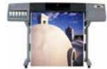
HP DesignJet 5000 / 5500 Printer 42"