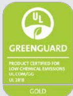
GREENGUARD GOLD da UL 9

As tintas HP Látex permitem maior diferenciação — impressões sem cheiro que podem ser usadas onde os solventes não podem.