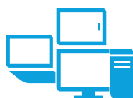
Tilknyttede eksterne enheder, herunder skærme, dockingstationer, tastaturer og mus

Tilmeld dig for at få opdateringer hp.com/go/getupdated