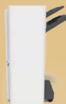
Ausgabereinheit mit Hefter und Locher