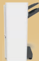
Nieten, stapelen, perforeren