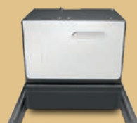
Pojedyncza szafka/ podstawa