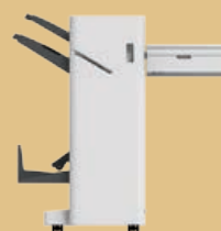
Urządzenie wykańczające do broszur