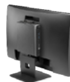
Ecosistema HP Pro