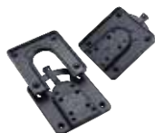
HP Quick Release