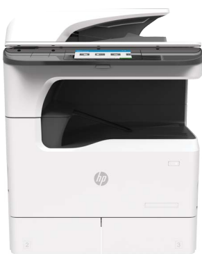
Stampante multifunzione HP PageWide Managed P75050 / P77750

Affidatevi alla qualità, all'affidabilità, alla sicurezza e al supporto specifico per soluzione, della gamma di stampanti e multifunzione HP A3 di nuova generazione. Caratteristiche quali stampa a colori dal prezzo contenuto, massima produttività e stampa più sicura al mondo, tipiche di questi nuovi prodotti, 6 consentono di migliorare l'esperienza globale di stampa contribuendo a ridurre i costi e aumentare la produttività.