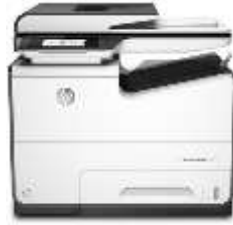
Impresora multifunción HP PageWide Pro 577dw