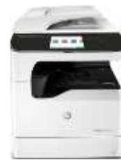
Impresora multifunción HP PageWide Pro 777z