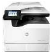
Impresora multifunción HP PageWide Pro 772dw