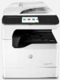
Impresora multifunción HP PageWide Pro 777z