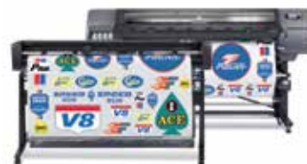
Soluzione di stampa e taglio HP Latex 335