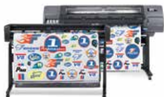
Soluzione di stampa e taglio HP Latex 315