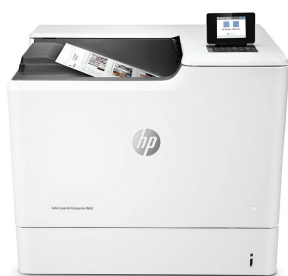
HP Color LaserJet Enterprise M652dn