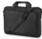
Maletín de Carga Superior Midnight para HP Executive 15,6"