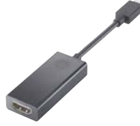
Adaptador HP USB-C™ a HDMI 2.0