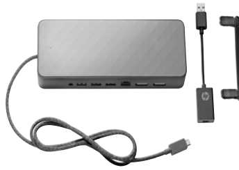
Base de acoplamiento universal HP USB-C