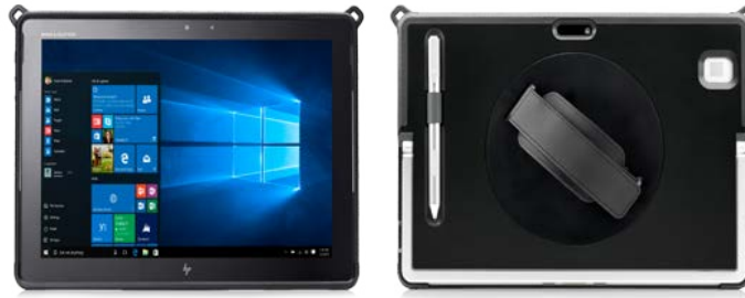
Funda Protectora para HP Elite x2 1012 G2